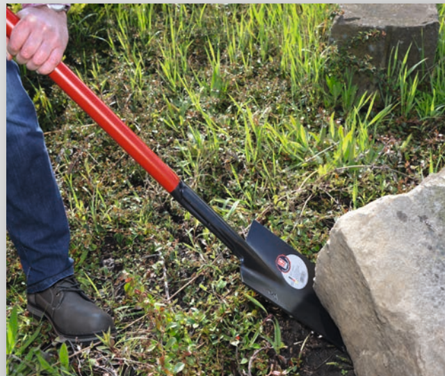
... oder dient als kompaktes Hebelwerkzeug im Bau und Garten!