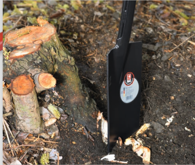
Der IDEAL-KRAFTSPATEN erleichtert das Durchtrennen von Wurzelwerk ...